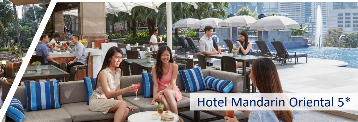
Hotel Mandarin Oriental 5*