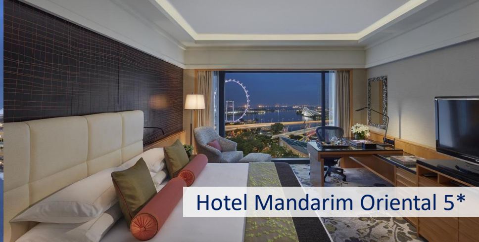
Hotel Mandarin Oriental 5*