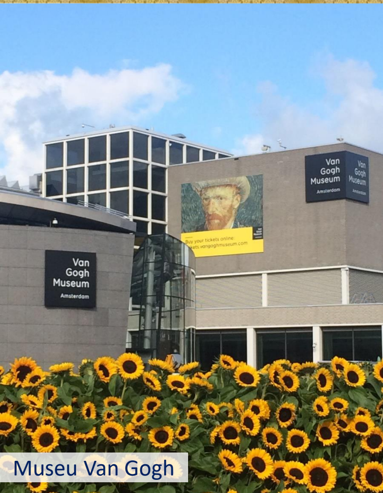
Museu Van Gogh