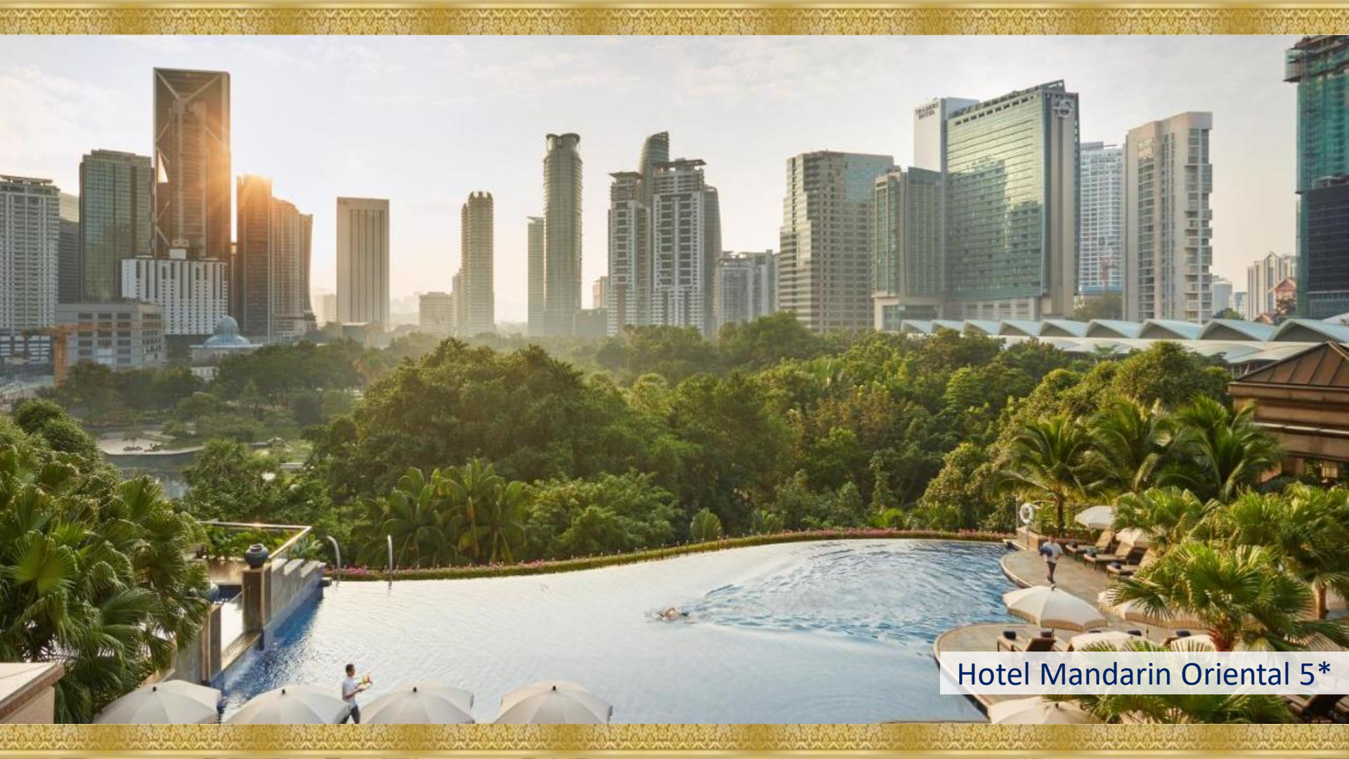
Hotel Mandarin Oriental 5*