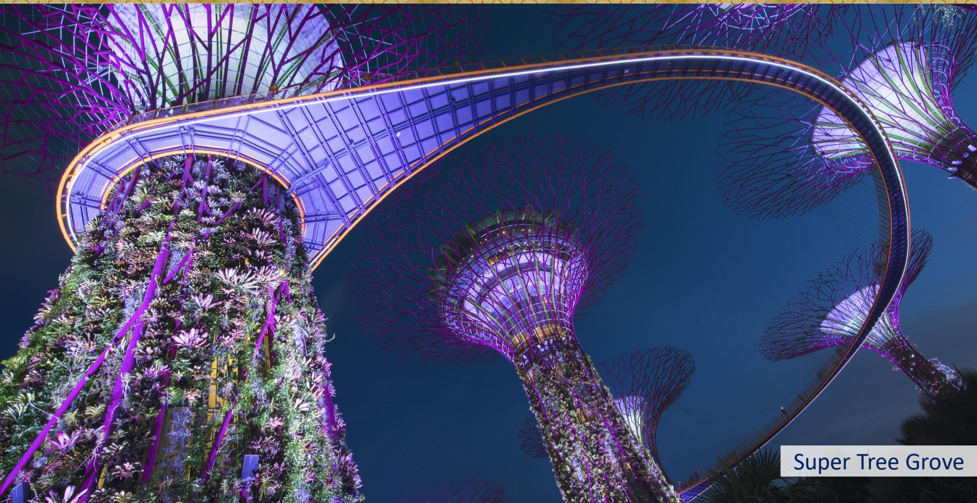
Super Tree Grove