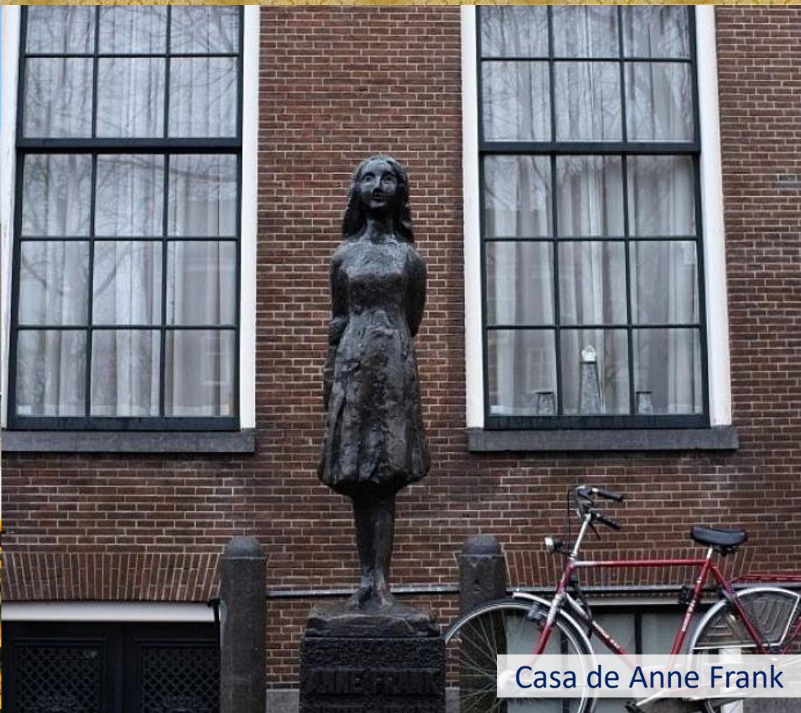
Casa de Anne Frank