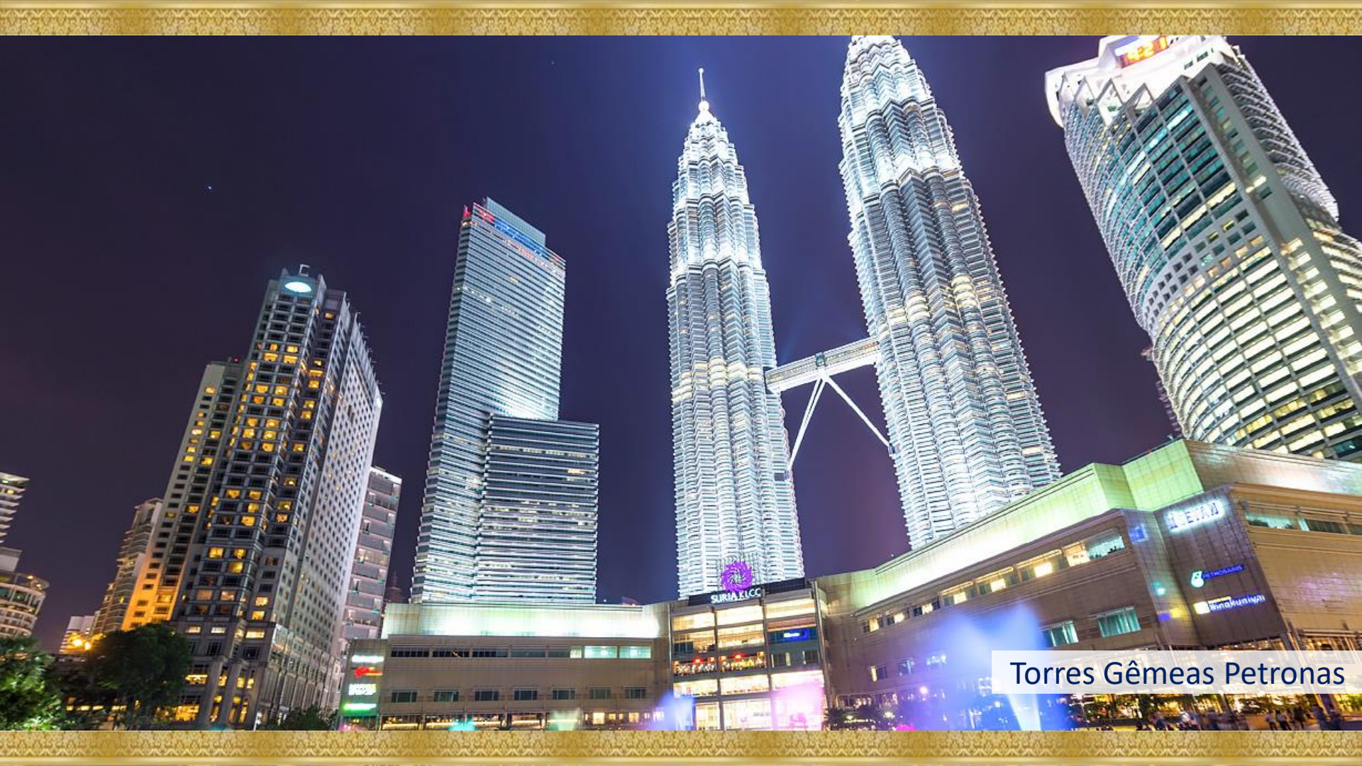
Torres Gêmeas Petronas